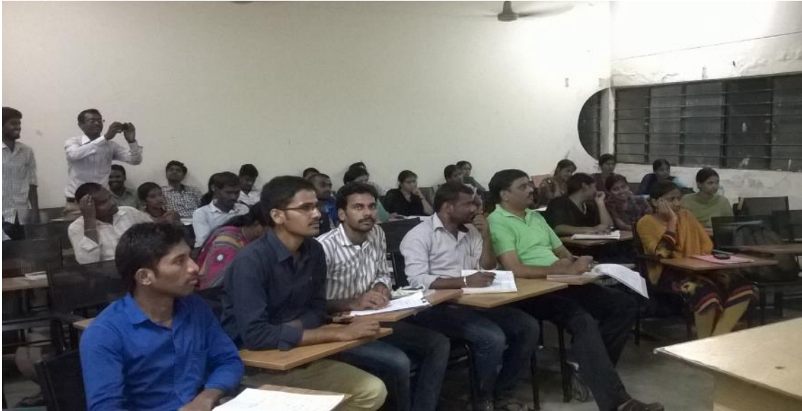
చర్చలో పాల్గొంటున్న విద్యార్థులు